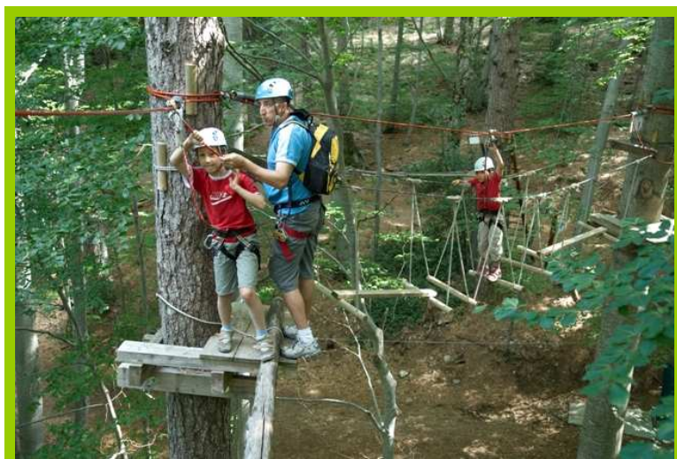
Balade d'arbres en arbres

Structure d'accueil et d'hébergement : Gite d'étape le Relais à Vizzavona