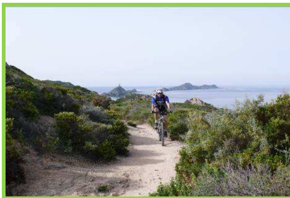
Les Iles Sanguinaires

Niveau : facile, étapes de randonnées comprises en moyenne entre 4 et 5 heures de marche . Une petite condition physique est nécessaire pour profiter pleinement de votre séjour. N'oubliez pas d'entretenir votre forme au moins une fois par semaine en roulant si possible sur un parcours avec dénivelé, ou en pratiquant une activité sportive.